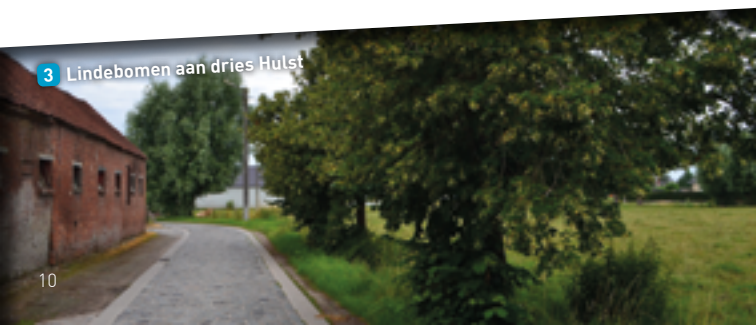
3 Lindebomen aan dries Hulst