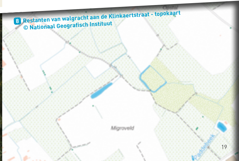
8 Restanten van walgracht aan de Klinkaertstraat - topokaart © Nationaal Geografisch Instituut

In de ErfgoedApp ontdek je krioelende beestjes en prachtige planten die floreren in poelen.