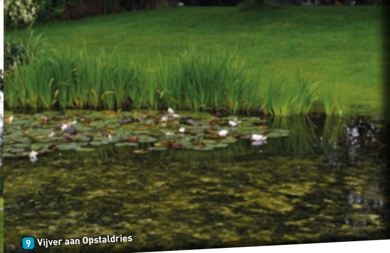
9 Vijver aan Opstaldries

Daarnaast zijn poelen ook belangrijk in de strijd tegen de klimaatverandering. Poelen vangen piekneerslag op. Hiermee zorgen ze voor voldoende watervoorraad in drogere periodes voor mens en dier.