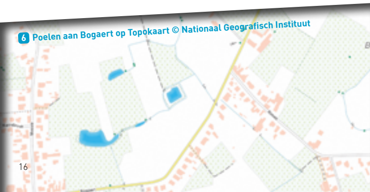
6 Poelen aan Bogaert op Topokaart © Nationaal Geografisch Instituut

Sla de eerste straat op Bogaert rechts in, Rimeir. Volg deze weg tot de Rimeirstraat. Ga hier rechts. Sla de tweede straat rechts, de Langestraat, in. Aan het volgende Erfgoedpunt, hoeve Lang Everen (Langestraat huisnummer 15) sla je rechts in. De oprit lijkt privaat, maar het is een trage weg die richting de Schuitemplasstraat leidt. Volg de route van het Ros Beiaardruitenetwerk. Het kaartje op p. 18 is ter verduidelijking.