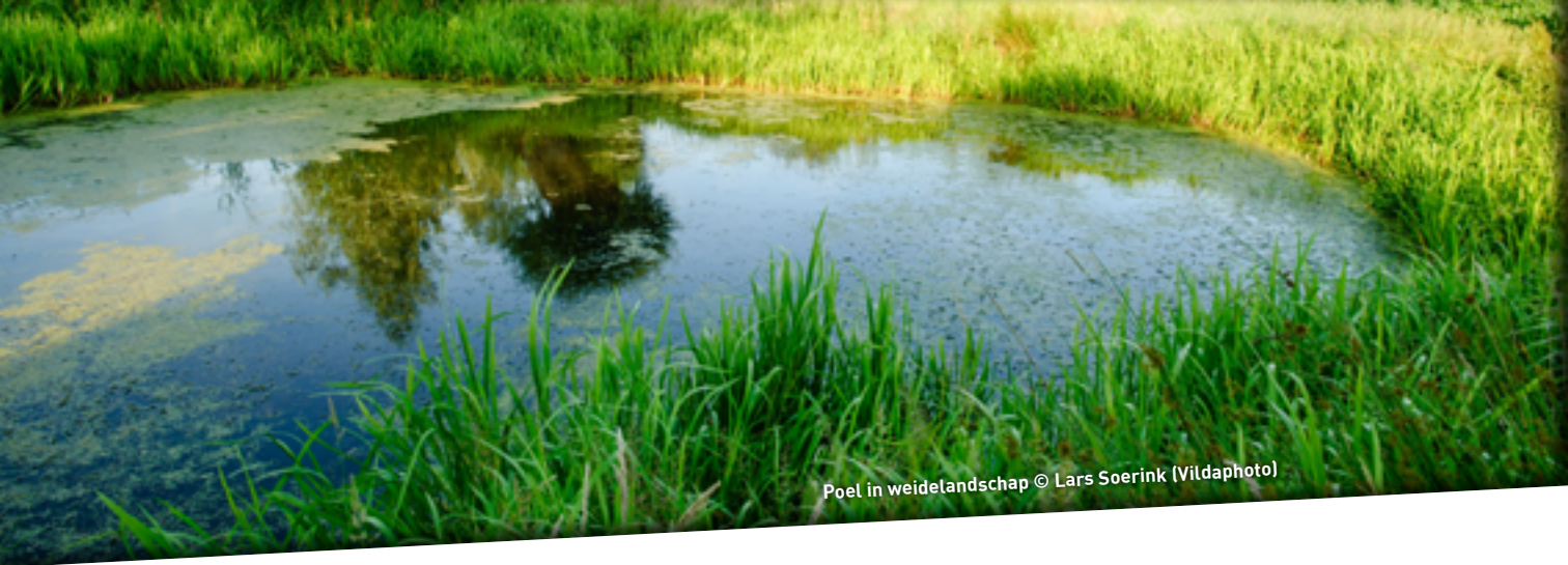
Poel in weidelandschap

Vlakbij de visvijvers bevindt zich de Brukkelenkapel. De 19e-eeuwse kapel gaat terug op een oudere, vermoedelijk 18e-eeuwse kapel, reeds opgetekend op de Villaretkaart (1745-1748). De aanwezigheid van de Brukkelenkapel wijst alvast op het belang van deze waterrijke plek voor onze voorouders.