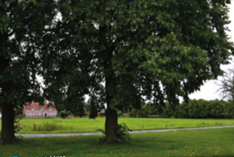
9 Plein Opstaldries