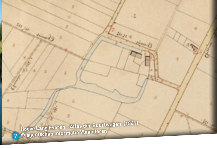
7 Hoeve Lang Everen - Atlas der Buurtwegen (1841)