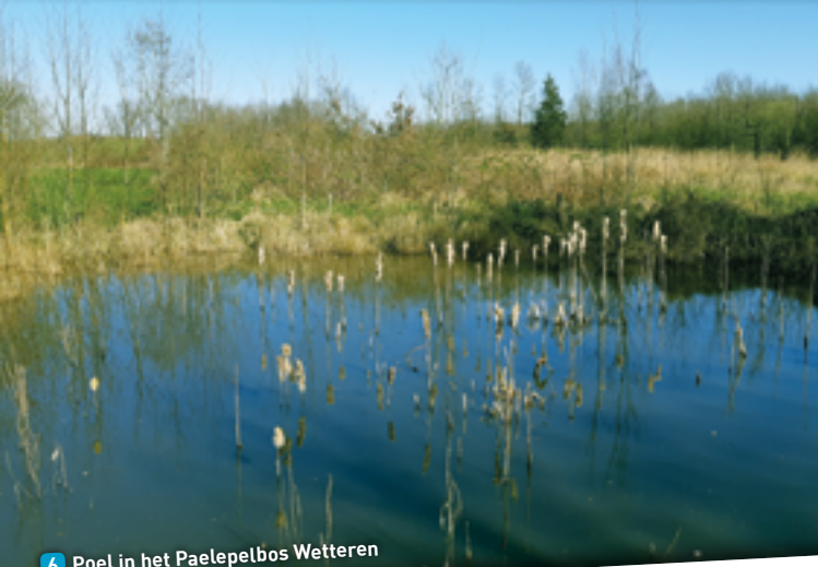
6 Poel in het Paelepelbos Wetteren