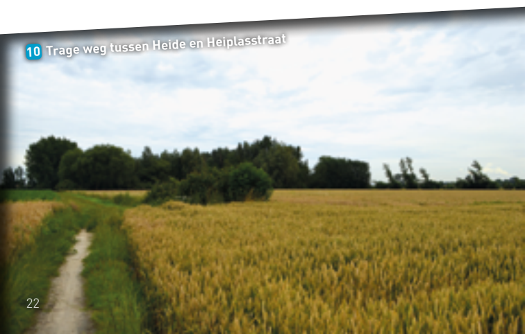
10 Trage weg tussen Heide en Heiplasstraat