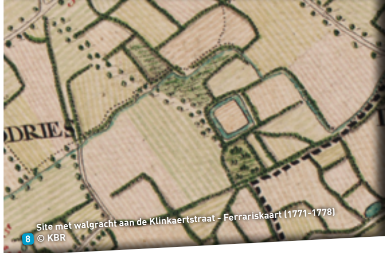
Site met walgracht aan de Klinkaertstraat - Ferrariskaart (1771-1778) 8

walgracht omgeven. De site was verbonden met de Klinkaertstraat via een dreef met bomen. Waarom de bewoners de site verlieten, daar hebben we het raden naar. Maar dat de sporen van hun bewoning vandaag nog steeds waardevol zijn, daar zijn we wel helemaal zeker van.