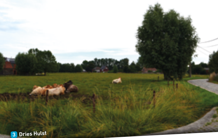
3 Dries Hulst