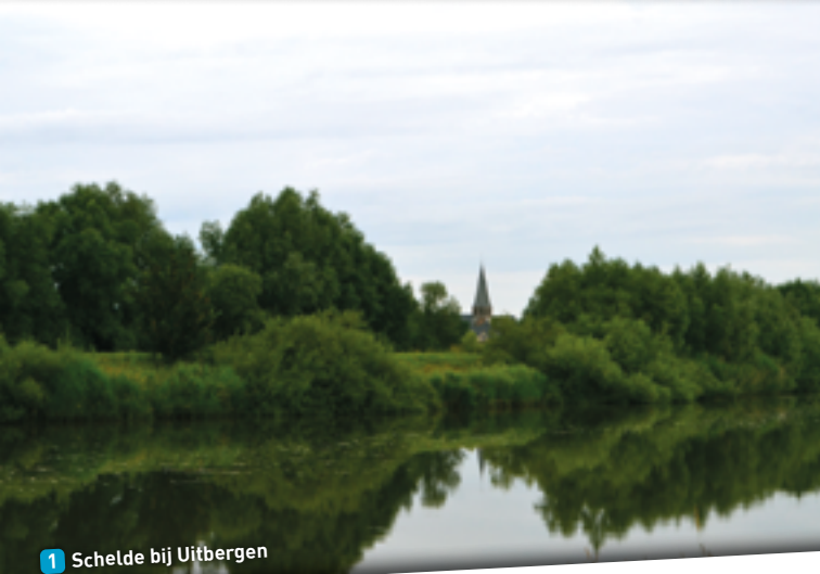
1 Schelde bij Uitbergen