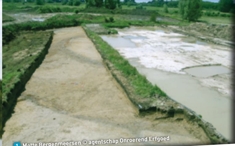
1 Motte Bergenmeersen

Start de fietsroute op de parking aan het Sociaal Huis, Oud Dorp 2 te Wichelen. Bij het verlaten van de parking, sla links Oud Dorp in. Volg Oud Dorp, vervolgens Pastorijdreef en sla voorbij de begraafplaats Paddenhoek in. Vervolgens volg je het fiets-/wandelpad langs de scherpe meanderbocht van de Schelde.